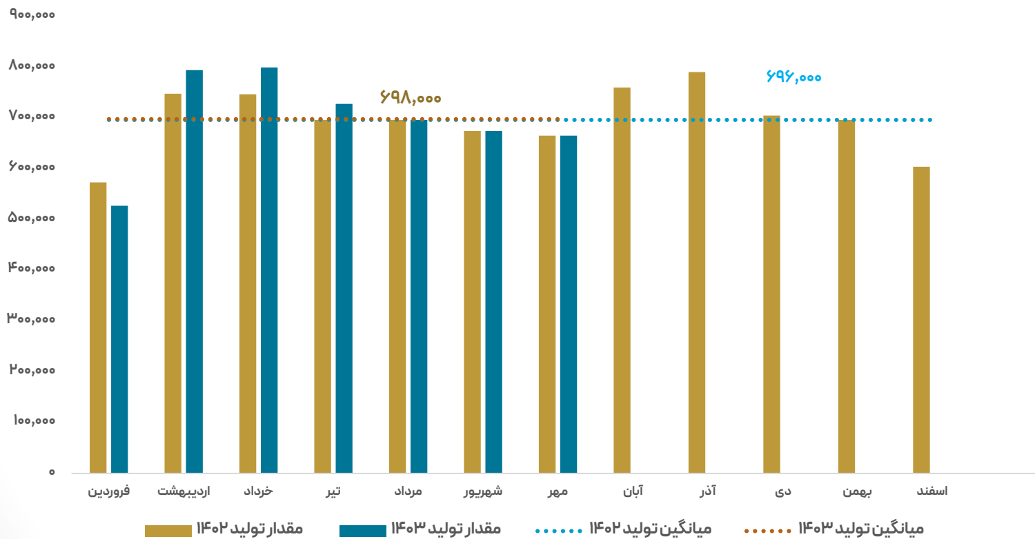
تولید ماهانه شرکت (متر مربع)

• در نمودار زیر روند تولید ماهانه شرکت ارائه شده است.